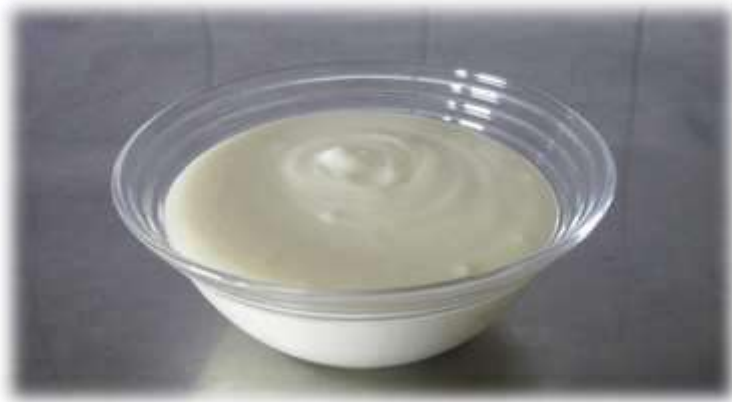
Ika Setyanti SMAN 1 Karanganyar