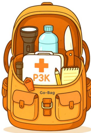
Gambar 6. 1 Ilustrasi Tas Siaga Bencana

Tas Siaga Bencana (TSB), atau yang sering disebut Go-Bag di kalangan internasional, adalah sebuah sistem pendukung kehidupan mandiri yang telah Anda siapkan sebelum bencana. Ini bukanlah tas yang Anda isi saat panik, melainkan "kapsul penyelamat" yang sudah siap sedia untuk Anda ambil dalam hitungan detik saat Anda harus meninggalkan rumah.